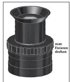
Abbildung 3. Fixiertes Okular